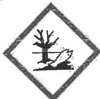
GHS09 Aquatic Acute 1